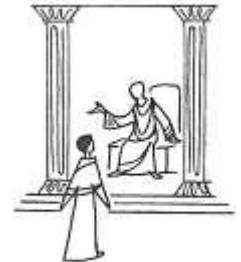
Jn 18, 33-37