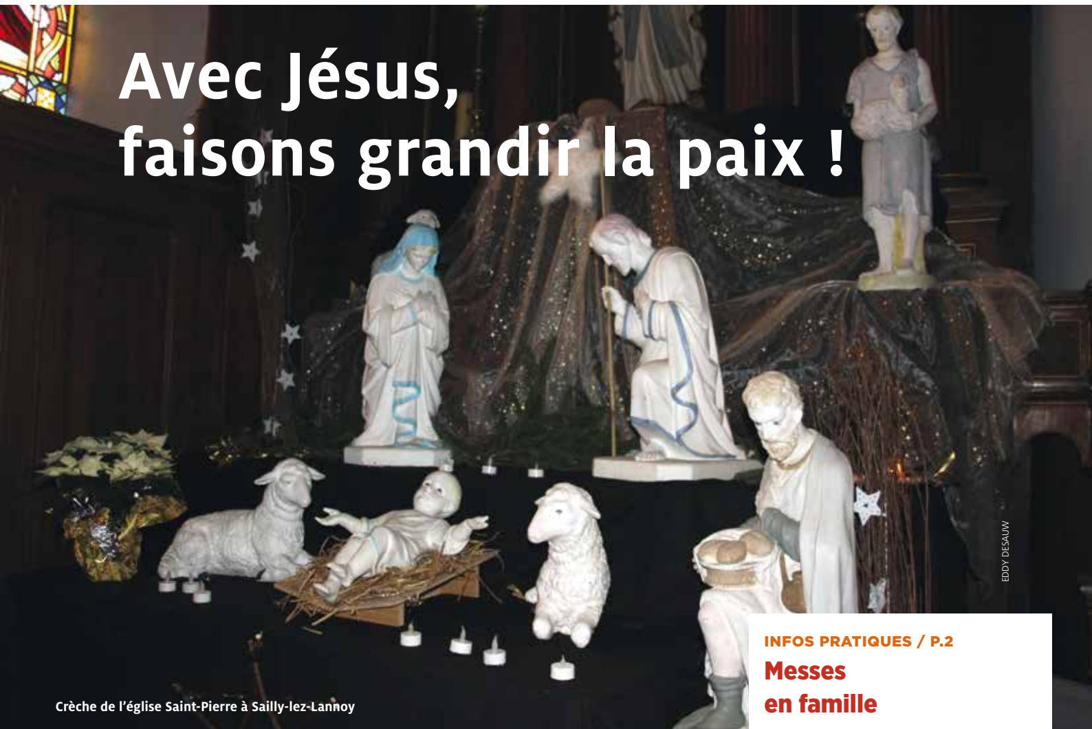
Crèche de l'église Saint-Pierre à Saily-lez-Lannoy