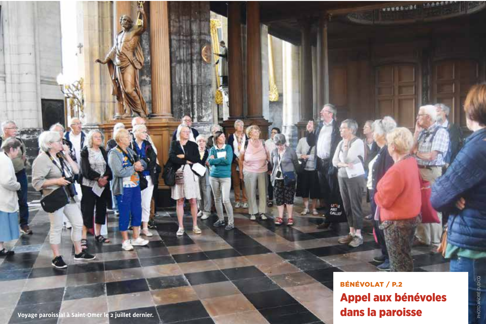
Voyage paroissial à Saint-Omer le 2 juillet dernier.

saint-jean-du-ferrain.doyennederoubaix.com