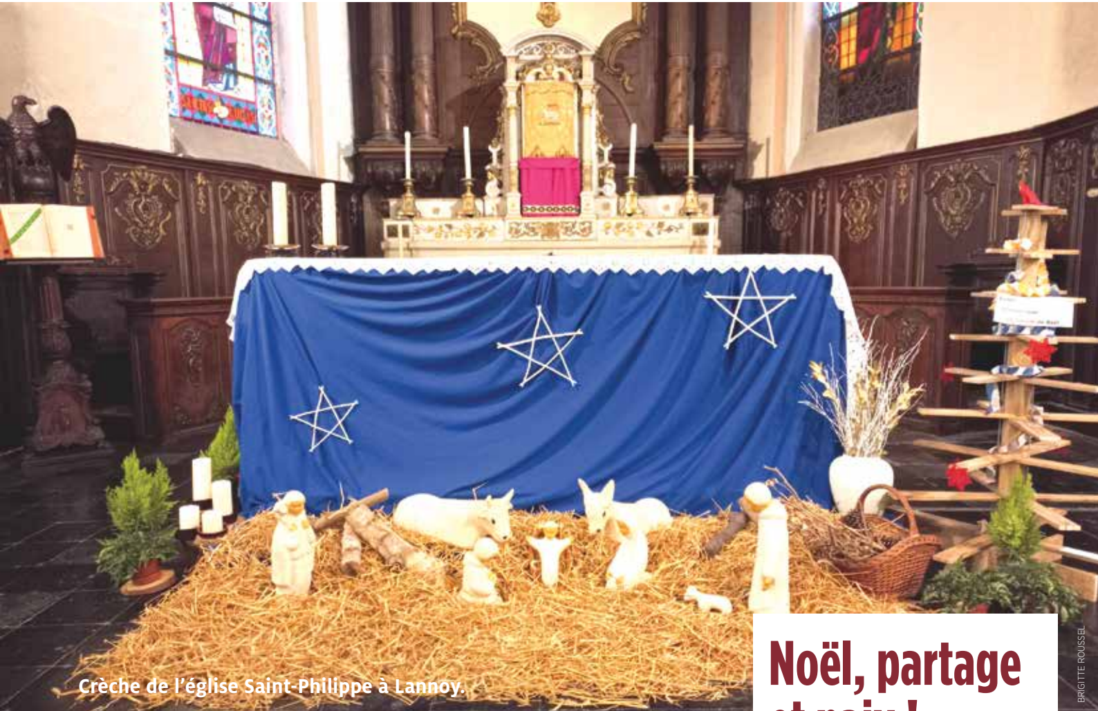
Crèche de l'église Saint-Philippe à Lannoy.

Paroisse Saint-Jean du Ferrain saint-jean-du-ferrain.doyennederoubaix.com