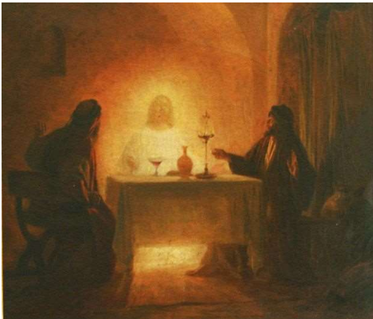
Le souper à Emmaüs – Eugène Girardet (1852-1907).

À l'instant même, ils se levèrent et retournèrent à Jérusalem. Ils y trouvèrent réunis les onze Apôtres et leurs compagnons, qui leur dirent : « Le Seigneur est réellement ressuscité : il est apparu à Simon-Pierre. » À leur tour, ils racontaient ce qui s'était passé sur la route, et comment le Seigneur s'était fait reconnaître par eux à la fraction du pain.