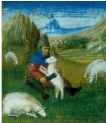
Le berger (Rustican) – Maître du Boccaccio de Genève (XV o s), musée Condé, Chantilly.

Grâce et bonheur m'accompagnent tous les jours de ma vie ; j'habiterai la maison du Seigneur pour la durée de mes jours.