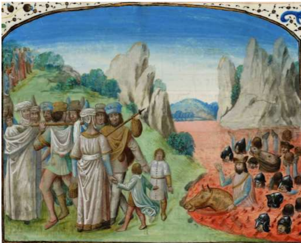
Le passage de la Mer Rouge (Rituel Machtots ; Ms. 2027) Toros Roslin (1210- 1270), Patriarcat arménien de Jérusalem.

Le Seigneur régnera pour les siècles des siècles.