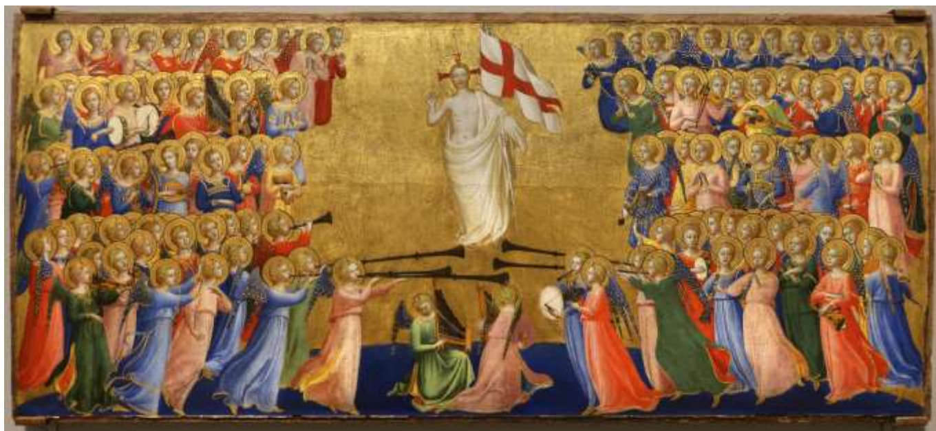
Christ glorifié dans la cour du Ciel - Fra Angelico (1395-1455),

C'est lui qui est notre Dieu : aucun autre ne lui est comparable. Il a découvert les chemins du savoir, et il les a confiés à Jacob, son serviteur, à Israël, son bien-aimé. Ainsi, la Sagesse est apparue sur la terre, elle a vécu parmi les hommes. Elle est le livre des préceptes de Dieu, la Loi qui demeure éternellement : tous ceux qui l'observent vivront, ceux qui l'abandonnent mourront. Reviens, Jacob, saisis-la de nouveau ; à sa lumière, marche vers la splendeur : ne laisse pas ta gloire à un autre, tes privilèges à un peuple étranger. Heureux sommes-nous, Israël ! Car ce qui plaît à Dieu, nous le connaissons.