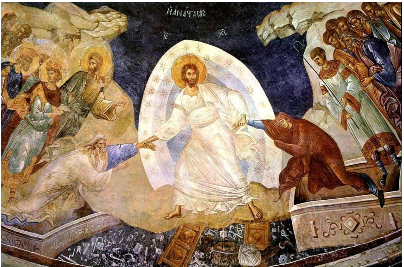
Le Christ ressuscité brisant les portes des Enfers pour chercher Adam et Ève, et les justes de la première Alliance (Anastasis, fresque du pareclésion, vers 1320) - Eglise Saint-Sauveur-in-Chora, Istanbul, Turquie.

Nous le savons en effet : ressuscité d'entre les morts, le Christ ne meurt plus ; la mort n'a plus de pouvoir sur lui. Car lui qui est mort, c'est au péché qu'il est mort une fois pour toutes ; lui qui est vivant, c'est pour Dieu qu'il est vivant. De même, vous aussi, pensez que vous êtes morts au péché, mais vivants pour Dieu en Jésus Christ.