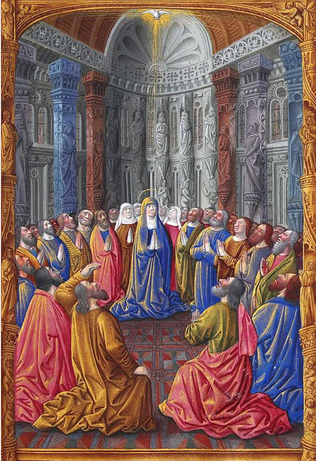
La Pentecôte (Les Très Riches Heures du duc de Berry) Jean Colombe (1430-1493), musée Condé, Chantilly

Je ne vous laisserai pas orphelins ; je reviens vers vous, et votre cœur se réjouira.