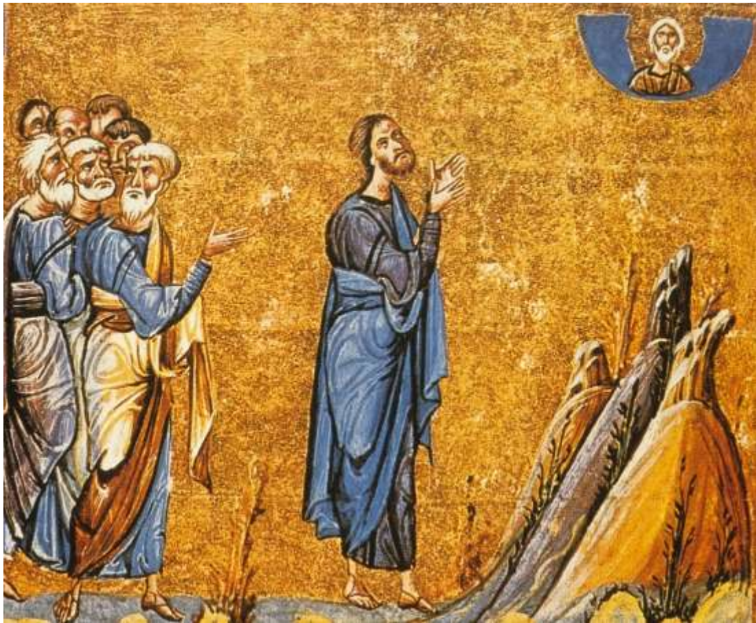
Le Christ priant son Père (XI ème s.) - Monastère de Dionysiou du Mont Athos, Grèce.

Moi, je prie pour eux ; ce n'est pas pour le monde que je prie, mais pour ceux que tu m'as donnés, car ils sont à toi. Tout ce qui est à moi est à toi, et ce qui est à toi est à moi ; et je suis glorifié en eux. Désormais, je ne suis plus dans le monde ; eux, ils sont dans le monde, et moi, je viens vers toi. »