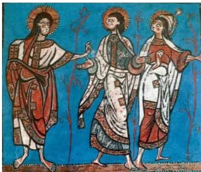
Jésus envoie ses disciples en mission - Sacramentaire de Saint Etienne de Limoges (~1100), BNF